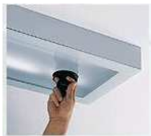
Sposób montażu bezramkowego szkła hartowanego

Oprawa do nabudowania w skrzynkach systemowych metalowych